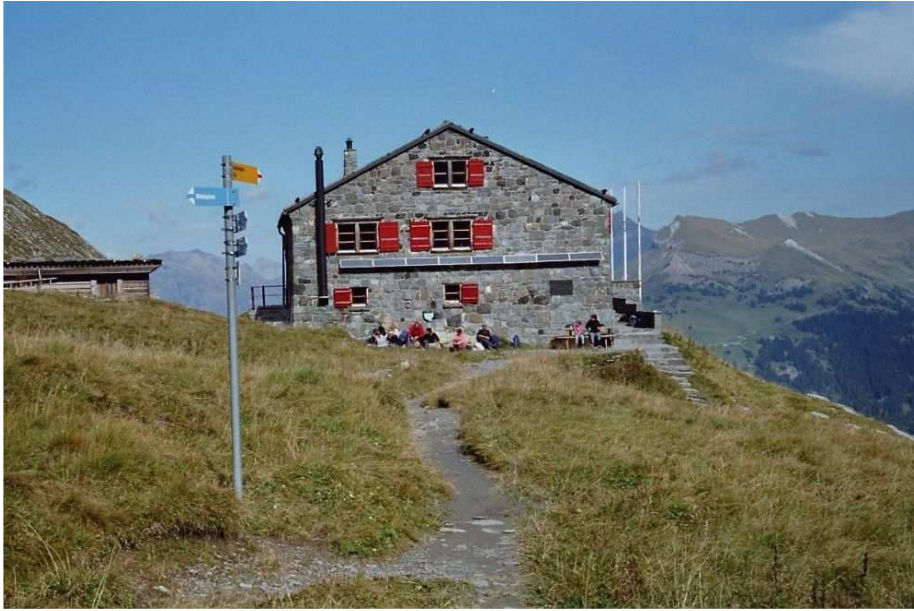
Martinsmad-Hütte der Sektion Randen